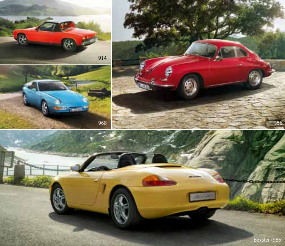
914 968 356 Boxster (986)